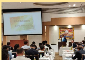
会社方針説明会・ISO勉強会・BCP活動・各種研修会等

当社では、社訓である「仕事に追われず 仕事を追え」を念頭に置き、廃棄物の適正処理を通じて、より快適な暮らしと豊かな社会づくりに貢献し、循環型社会の一翼を担い、企業として日々果たすべき使命や存在意義を常に考えおります。そして、常に高い志を持ち、真のプロフェッショナルとして誠実に事にあたりたいと考えております。