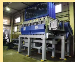
【タイヤ事業部】 国内初導入機械