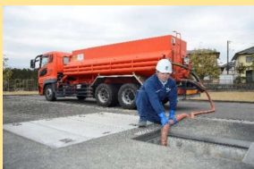
浄化槽清掃業・浄化槽保守点検業