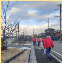
周辺清掃（月1回実施）